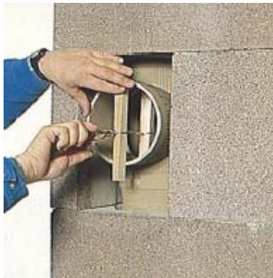
91 Stutzen / Zarge am Schamotterrohr anrödeln. Abtropfkante ausführen, diese verhindert Wasseraustritt.