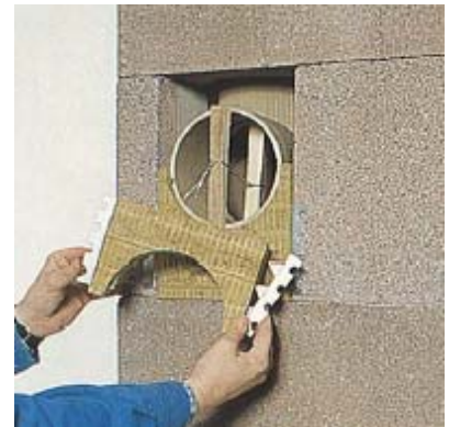
92 Frontplatte versetzen.