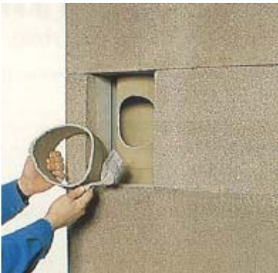
90 Nach Anfeuchten beider Kittflächen Fugenmasse auf Stutzen / Zarge auftragen.