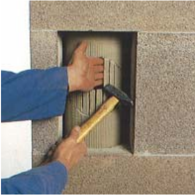
87 Schamotteteile vorsichtig entfernen.