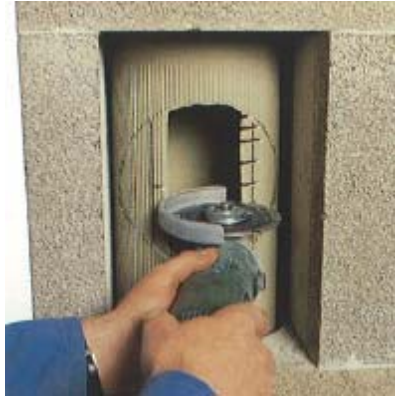
88 Verbleibende seitliche Segmente streifenförmig einschneiden.