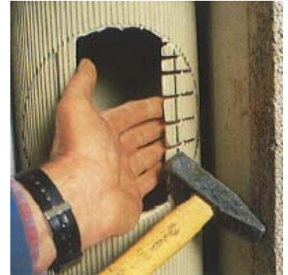
89 Schamotterrohr vorsichtig entfernen.